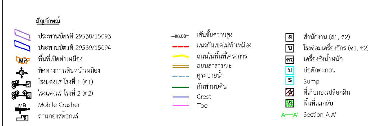
รูปที่ 1-4 แสดงสภาพหน้าเหมืองเมื่อสิ้นสุดการทำเหมืองปีที่ 1